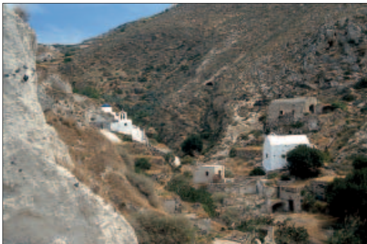
Eindrücke am Wanderweg von Pýrgos nach Emborío

Natursteinen gepflasterter Eselspfad, dem man nach Süden folgt, wobei man in ein Erosionstal hinunterwandert, das Richtung Emborío immer enger und tiefer wird. Auf Santoríni gibt es Dutzende solcher Täler. In diesem Abschnitt des Wegs ist auch das Gestein , aus dem die Mauern errichtet wurden, einen Blick wert: schwarze, rote und gelbliche sowie gemischtfarbige Lavabomben, dazu Tuff, Bims und ausgewaschene Steine aus dem Meer.