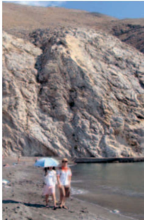
Spaziergang am langen Sandstrand

Südwestlich von Perússa schließen sich die ebenfalls weit ausladenden Strandgebiete von Limnes und Perivolos an. In den letzten Jahren ist hier eine riesige, weit ausufernde Ferienstadt entstanden,