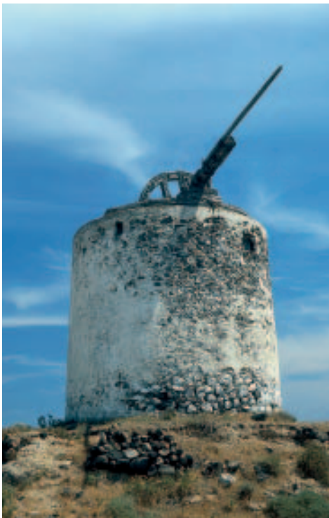
Windmühle südlich von Emborío

Die Kirche Ágios Nikólaos Marmarítis steht an der Durchgangsstraße kurz vor dem Ortseingang von Westen her. An der Stelle der heutigen kleinen, dem heiligen Nikolaus geweihten Kirche aus naxiotischem Marmor (daher der Beiname) gab es hier früher einen Tempel aus dorischer Zeit (3. Jh. v. Chr.). Die Ikonostase mit dem Ágios Nikólaos ist zwischen zwei Säulen ionischen Stils eingepasst, oben erkennt man ein Gesims dorischen Ursprungs. Ebenfalls aus Náxos stammt der Marmor für die weiteren Pfeiler im Innenraum.