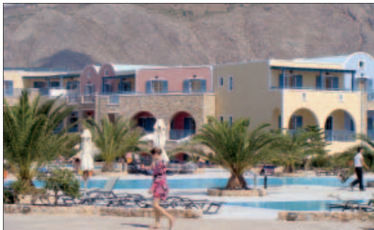
Strandhotel bei Perissa

**** Hotel Santo Miramare (40) , einladendes Badehotel an der Strandstraße in Richtung Perívolos, alles in freundlichen Farben gehalten, großzügige Poolanlage, geschmackvolle Räumlichkeiten, Beach Volley am Strand, Restaurants und Bars im Umkreis. Wird hauptsächlich über Reiseveranstalter gebucht. DZ mit Frühstück ca.