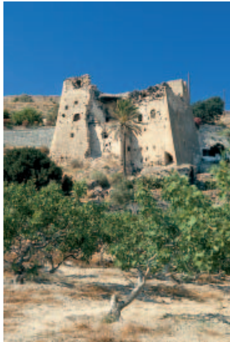
Der gut erhaltene Pýrgos Góúlas in Emborío

Wer jedoch nicht von der Platía direkt die Gasse hinaufsteigt, sondern westlich des Kiosks in die Straße einbiegt, trifft auf den besterhaltenen Pýrgos von Santoríni. Der bullige Wohnturm Góúlas Froúrio aus byzantinischer Zeit diente bei Belagerungen als Fluchtburg. In venezianischer Zeit wurde er nach der Herrscherfamilie d'Argenta benannt. Im