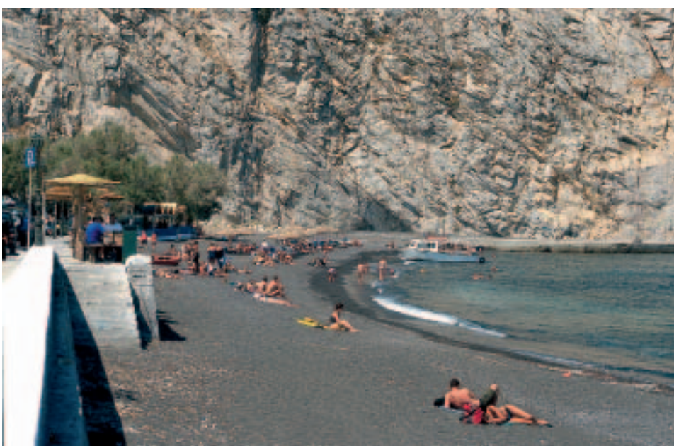
Der feine, dunkle Lavastrand von Perissa liegt unterhalb einer mächtigen Felswand